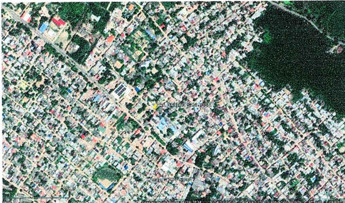
Imagen 1. Arboles establecidos en la solicitud de tala

El día 10 de julio siendo las 3:00 Pm se realiza el desplazamiento a la Calle 14# 16-80 en el Barrio San José más exactamente en las coordenadas geográficas 9°14'40"N -74°45'22" W en donde se logró verificar las afectaciones de 2 árboles de la especie Bolombolo ( Andira sp) y un árbol de Nim (Azadirachta indica) los tiene una alturas aproximadas que oscila entre los 4 a 6metros y diámetros que van entre los 70 a 95 centímetros los cuales se encuentran inclinados debido al debilitamiento de su parte inferior lo que género que dichos individuos perdieran su anclaje ocasionando que deban realizarse de manera inmediata su TALA ya que genera un riesgo inminente de caída. Por lo tanto, se hace referencia que dicho informe debe hacerse llegar al comité Municipal de Gestión de Riesgo para dar conocimiento del mismo. Dichos individuos arbóreos se encuentran sostenidos por el cableado tanto eléctrico como de telefonía que existe en la copa. Lo cual genera un inminente riesgo de caída y afectación a la población que transita por el lugar ya que es un sitio de gran afluencia ya que se encuentra contiguo a la clínica de Vital Caribe.